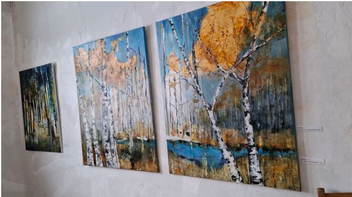
Birken in Herbststimmung.

Der analogen Fotografie hat sich Martin Hauser verschrieben. Seinen Schwarz-Weiß-Werken widmet er große Sorgfalt. Da finden sich Regentropfen auf dem Fenster, der Himmel mit unterschiedlichen Wolkenformationen, ein Strandumkleidehäuschen, dessen Linien wie eine über das Motiv gelegte Zeichnung wirken, entstanden aber nur durch bestimmte Lichtstimmung und -einstrahlung.